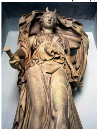
Foto 20: Selene, https://ro.wikipedia.org/wiki/Selene#/media/Fi%C8%99ier:Luna_statue.jpg , Accesare site: 01. 06. 2024.

Zeița Selena/Selene din Panteonul grec are embleme, precum: caleașca de argint trasă de doi cai albi, coroana cu semiluna pe cap, torța (foto 20).