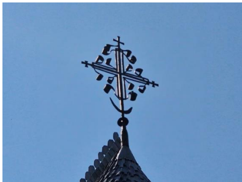
Foto 19: Crucea din vârful bisericii la baza căreia se află semiluna, Biserica de lemn „Sfinții Arhangheli Mihail și Gavril”, Șurdești, Zona Chioarului, Maramureș, https://www.directmm.ro/special/surdesti-biserica-greco-catolica-sfintii-arhangheli-mihail-si-gavril-pastratoare-a-credintei-si-identitatii-noastre/ , Arhivă foto: 31. 05. 2024.