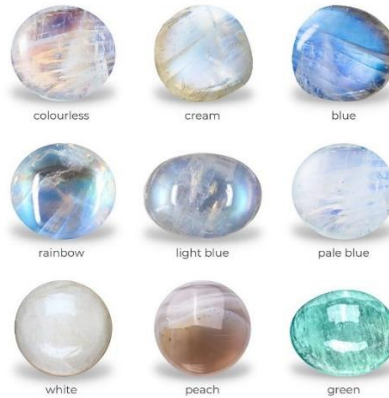
Foto 16: Piatra lunii, https://www.leador.ro/piatra-lunii-pret-beneficii-caracteristici/ , Accesare site: 03. 06. 2024.