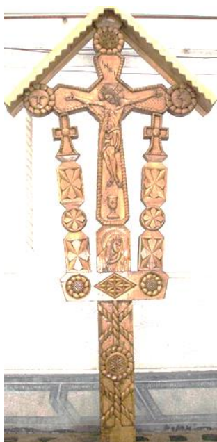
Foto 23: Troiță, Autor: Buda Cătălin, Târgu Lăpuș, Țara Lăpușului, Maramureș, Arhivă foto personală.

De asemenea, luna este corelată cu trei stele: „Sfânta Magdalena, Sfânta Varvara și Sfânta Maria” 10 . Aceste exemple potențiază sacralitatea astrului selenar.