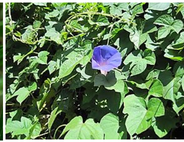
Foto 17c: Floarea-lunii ( Ipomoea violacea ), http://www.eastafricanplants.senckenberg.de/root/index.php?page_id=47&id=4108 , Accesare site: 30. 05. 2024.