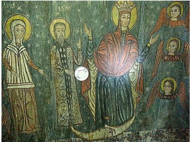
Foto 1b: Luna și Maica Sfântă, Biserica de lemn „Arhanghelii Mihail și Gavril”, Rogoz, Țara Lăpușului, secolul al XVI-lea, Maramureș, Arhivă foto personală.

i_2 Luna este reprezentată în lăcașurile de cult în ipostaze diferite, fie alături de sfinți ( foto 2 ), fie în preajma balaurului cu șapte capete care, smulgând luna de pe cer, anunță apocalipsa ( foto 3 ).