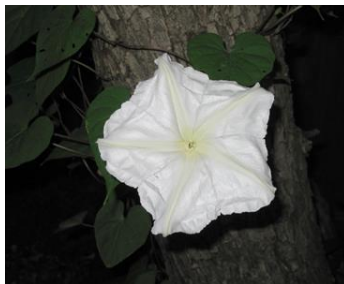
Foto 17a: Floarea-lunii ( Ipomoea alba ), https://en.wikipedia.org/wiki/Ipomoea_alba , Accesare site: 30. 05. 2024.

Lunii, denumită Moon Flower sau Calea Noptii , este o floare spectaculoasă aflată sub oblăduirea astrului selenar.