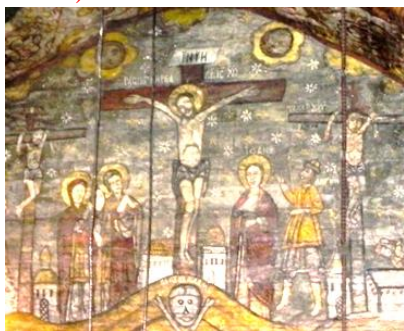
Foto 21: Soarele și luna, Răstignirea Mântuitorului, Biserica de lemn, Desești, secolul al XVIII-lea, Țara Maramureșului, Maramureș, Arhivă foto personală.

Se crede că podoabele cerului au fost în asentimentul Mântuitorului în momentul crucificării. Chipurile podoabelor astrale emană tristețe. Atât picturile murale din incinta lăcașurilor de cult, cât și troițele potențiază acest aspect (foto 21, foto 22, foto 23).