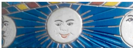
Foto 11: Astrul selenar alături de soare pe cruce de mormânt, Săpânța, Cimitirul Vesel, Maramureșul istoric, județul Maramureș.

14 Pictorii, dând dovadă de talent și de creativitate, ilustrează soarele și luna într-un stil propriu care emană căldură sufletească (foto 12, foto 13).