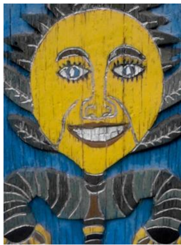
Foto 9: Luna antropomorfizată pe poartă tradițională, Săpânța, Maramureșul Voievodal, Autor: Ioan Stan Pătraș, Maramureș, Arhivă foto personală.