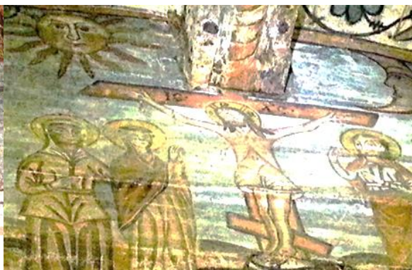
Foto 22: Soarele și luna, Răstignirea Mântuitorului, Biserica de lemn, Rogoz, secolul al XVI-lea, Țara Lăpușului, Maramureș