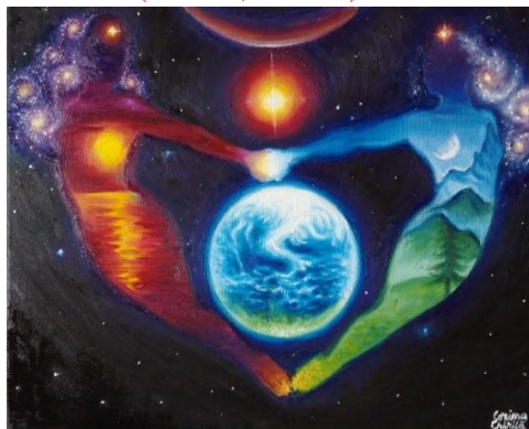
Foto 13: Iubire cosmică: Soarele și luna, Autor: Corina Chirilă, https://desenepicturi.com/2010/05/20/ea-este-