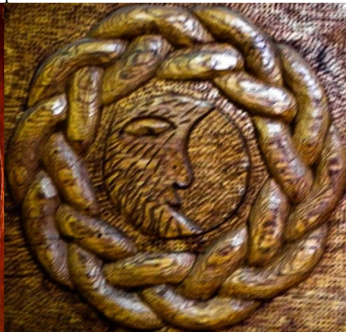
Foto 6: Luna antropomorfizată pe bibliotecă, Valea Stejarului, Țara Maramureșului, Autor: Petru Godja (Moș Pupăză), Maramureș, Arhivă foto personală.

Foto 7: Luna pe ușa de la intrare, Valea Stejarului, Țara Maramureșului, Autor: Petru Godja (Moș Pupăză), Maramureș, Arhivă foto personală.