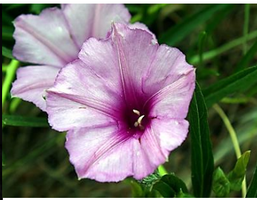
Foto 17b: Floarea-lunii ( Ipomoea leptophylla ), https://en.wikipedia.org/wiki/Ipomoea_leptophylla#/media/File:Ipomoea_leptophylla_NPS-1.jpg , Accesare site: 30. 05. 2024.