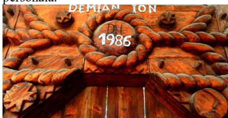
Foto 10: Soarele și luna pe poartă tradițională, Sârbi, Maramureș, Țara Maramureșului, Arhivă foto personală.