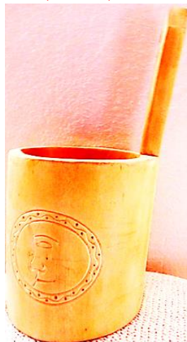
Foto 4: Luna antropomorfizată pe pecetar, Autor: Buda Cătălin, Târgu-Lăpuș, Țara Lăpușului, Maramureș, Arhivă foto personală.

Foto 5: Luna antropomorfizată pe sărăriță, Autor: Buda Niculae, Târgu-Lăpuș, Țara Lăpușului, Maramureș, Arhivă foto personală.