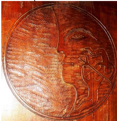
Foto 5: Luna antropomorfizată pe sărăriță, Autor: Buda Niculae, Târgu-Lăpuș, Țara Lăpușului, Maramureș, Arhivă foto personală.

Foto 4: Luna antropomorfizată pe pecetar, Autor: Buda Cătălin, Târgu-Lăpuș, Țara Lăpușului, Maramureș, Arhivă foto personală.