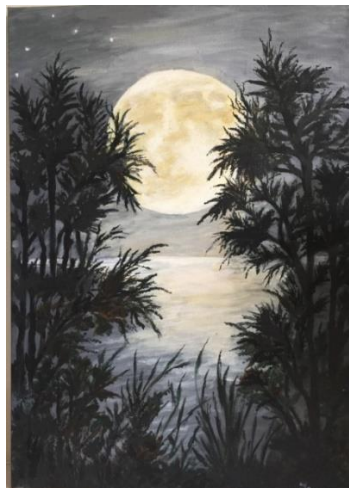
Foto 15: Luna

15 Piatra lunii este un simbol al feminității. Această piatră semiprețioasă conferă armonie, generează plenitudine, protecție. Piatra lunii este un simbol al ființei depline: „emoție și intelect, conștient și subconștient, fiind în principiu o piatră a echilibrului și a stabilității [...]. În Antichitate, cei care își căutau iubirea adevărată țineau o bijuterie cu piatra lunii în mâini, în timpul lunii pline, imaginându-și cum dragostea va veni spre ei” 3 . Piatra lunii emană mister, dar și o strălucire opalescentă. Panteonul roman și grec corelează piatra lunii cu zeițe, precum: Diana, Afrodita, Selena. Nuanțele sunt radiante – fie un joc de culori între albastru, galben și roz, fie un joc între alb și gri, fie albastru luminos, fie albastru pal etc. Piatra lunii este o gemă translucidă care oferă un joc de culori care se schimbă în contact cu lumina. Cele mai căutate sunt cele translucide cu un luciu albastru sau de un alb lăptos ( foto 16 ).