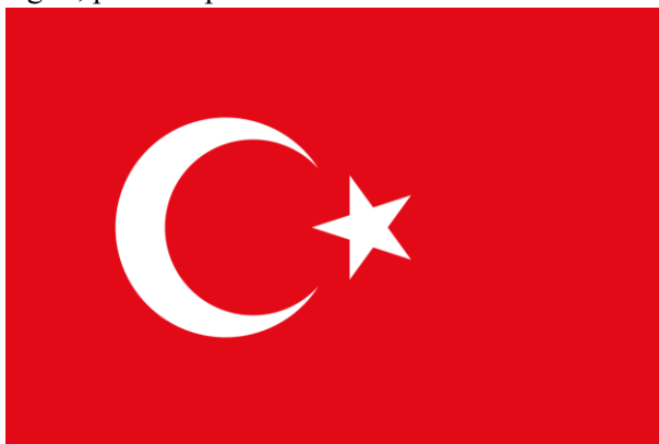
Foto 18: Drapelul Turciei, https://ro.wikipedia.org/wiki/Drapelul_Turciei#/media/Fi%C8%99ier:Flag_of_Turkey.svg , Accesare site: 31. 05. 2024.

Semiluna aflată la baza crucii aninate în vârful bisericilor străvechi de lemn din județul Maramureș ne determină să realizăm o incursiune în timp. Semiluna, simbol al credincioșilor musulmani, regăsită și pe drapelul turcilor (foto 18), este inedită atunci când apare alături de crucea creștină (foto 19). Dovezile istorice atestă faptul că tătarii nu profanau lăcașurile de cult creștine care aveau aninată semiluna. De asemenea, ușa joasă de la intrare nu permitea intrarea în lăcașul de cult călare pe cal pentru a o pângări, pentru a profana biserica sau mănăstirea.