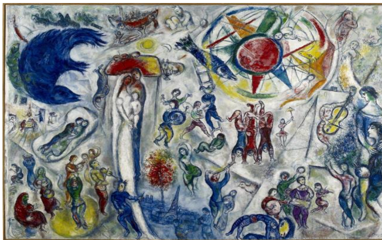
Fig. 2. Marc Chagall, La vie (1964) 27