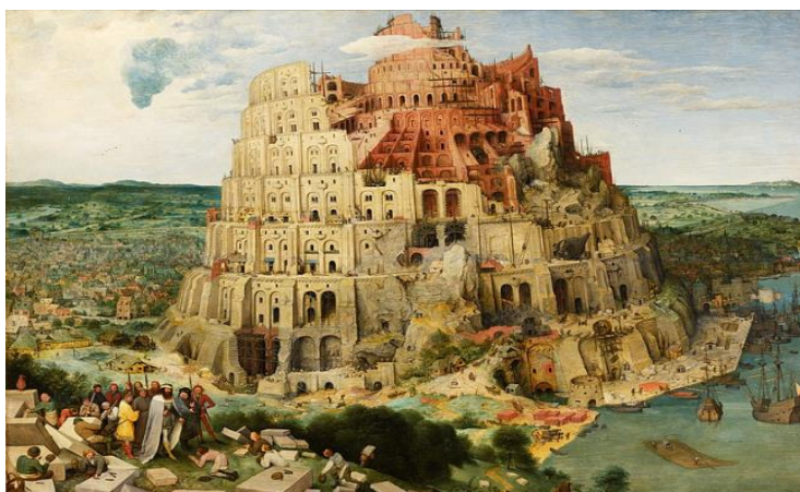
Fig. 1. Pieter Bruegel, Turnul Babel 24

După cum pomenise Nicolae Steinhardt în jurnalul său, tabloul lui Pieter Bruegel înfățișează Turnul Babel ca imagine a unui balamuc perpetuu, putând fi asociat cu „un Babilon al păcatelor, a căror consecință este pierderea luminii harului și damnarea la moarte veșnică în temnița eschatologică a infernului” 25 . Turnul Babel devine asemenea unei temnițe pestrițe, dar pe verticală, cu valorile răsturnate, promovând o alegorie a viciilor și a păcatelor capitale precum mândria, lăcomia, invidia, mânia, care sădesc nemulțumirea și neînțelegerea între oameni. Dornici să se înalțe până la cer, oamenii lipsiți de modestie și mai ales de credință uită adevăratele valori care le alcătuiseră existența: devin aroganți, lacomi și invidioși, vor să își măsoare puterile cu divinitatea și se consideră asemenea lui Dumnezeu. Oamenii se închină în fața altor oameni care poartă masca superiorității și ambele tabere uită de existența demiurgului care le-a hărăzit o viață senină și fericită, în bună înțelegere și armonie, valori care, din nefericire, nu le-au mai fost suficiente.